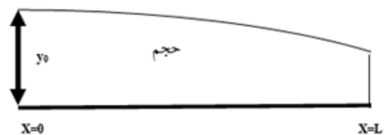
شکل ۱. ذخیره سطحی در طول فاز ذخیره

در این رابطه، y عمق جریان در فاصله x ، y_0 عمق در ابتدای جویچه، S فاصله از ابتدای جویچه تا انتهای جبهه پیشروی، x فاصله پیشروی در زمان مشخص و \beta ثابت انحنای بیان‌کننده شکل پروفیل سطح آب در طول جویچه است (شکل ۱).