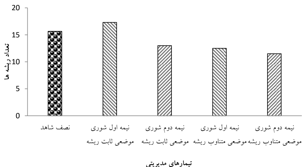
شکل ۴. مقایسه نصف تعداد ریشه‌ها در تیمار شاهد با تعداد ریشه‌ها در دو نیمه تیمارهای موضعی ثابت و متناوب ریشه

تعداد ریشه‌ها در تیمار شاهد (۳۱/۳ عدد) و در تیمارهای مدیریتی، شوری موضعی ثابت ریشه (۳۰/۳ عدد)، مخلوط (۲۹/۷ عدد)، دوره‌ای (۲۴/۳ عدد) و شوری موضعی متناوب ریشه (۲۴ عدد) به ترتیب ۵، ۲۲ و ۲۳ درصد کاهش را نشان داد. شکل (۴) تعداد ریشه‌ها در دو نیمه تیمارهای شوری موضعی ثابت و