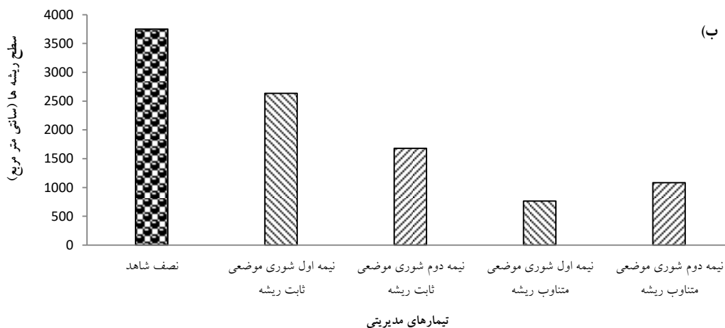
شکل ۵. مقایسه نصف حجم و سطح ریشه‌ها در تیمار شاهد با حجم و سطح ریشه‌ها در دو نیمه تیمارهای موضعی ثابت و متناوب ریشه