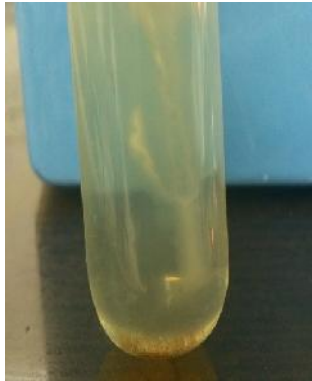
شکل ۲: آزمون حرکت مثبت

شکل شدن مسیر حرکت باکتری رویت شد. نتیجه این آزمون برای تمامی باکتری‌ها مثبت بود.