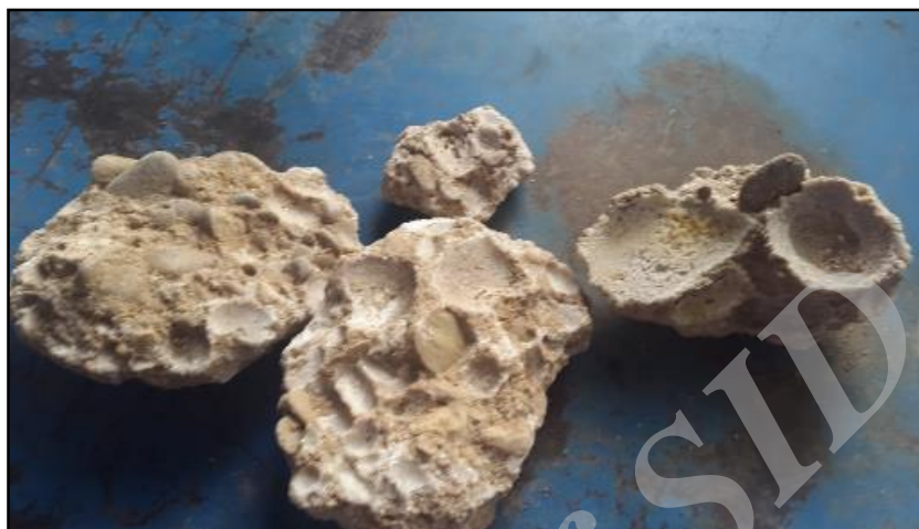
شکل ۴- توده‌های بلورین گچی در خاک خارج شده از بستر کانال در کیلومتر ۴۰+۲۴

حاصل از بازدیدهای میدانی، مشکل‌آفرین بودن خاک بستر محرز تشخیص داده شد. بدین معنی که خرابی‌ها به‌واسطه