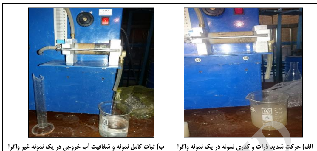
شکل ۶- مراحل مختلف آزمایش بین‌هول