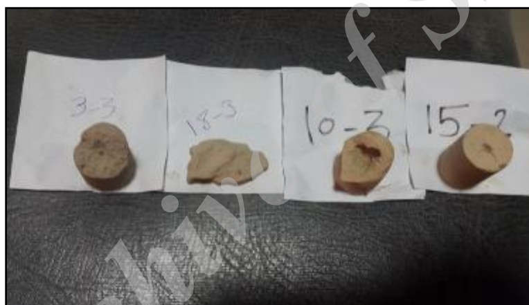
شکل ۷- وضعیت نمونه‌های آزمایشی پس از آزمایش بین‌هول

تمهیدات لازم برای کنترل خطر گچ، از جمله آب‌بندی کانال و جلوگیری از ورود آب به پشت پوشش، خطر واگرایی نیز کنترل خواهد شد.