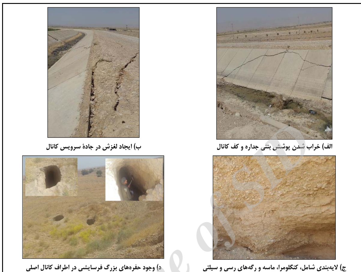
شکل ۲- لایه‌بندی خاک منطقه و خرابی‌ها در پوشش کانال