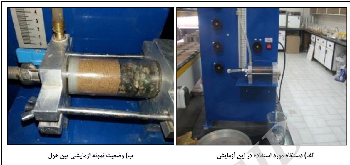
ب) وضعیت نمونه آزمایشی بین هول