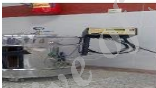
شکل ۱- دستگاه پیرولیز چوب Figure 1. System of wood pyrolysis

برای انجام این پژوهش یک نمونه خاک غیر زراعی آهکی فقیر از فسفر از عمق ۳۰-۰ سانتی‌متری تهیه و پس از هوا خشک شدن از الک ۲ میلی‌متری عبور داده شد. برای تهیه بیوچار ضایعات هرس درختان سیب و انگور بعد از جمع-آوری به قطعات کوچک خرد شده و بعد از خشک شدن در آن در دمای ۷۰ درجه سلسیوس، عمل پیرولیز در دمای ۴۰۰ درجه سلسیوس به مدت یک ساعت با گرمادهی آهسته توسط کوره با ارتفاع فضای داخلی ۵۰۰ و قطر ۴۰۰ میلی‌متر و مجهز به سیستم حسگرهای اندازه‌گیری دقیق کنترل دما و فشار انجام گرفت (شکل ۱). مواد بدست آمده از پیرولیز (بیوچار) پودر شده و از الک ۲ میلی‌متری عبور داده شدند و به آزمایشگاه برای مطالعات بعدی منتقل یافتند.