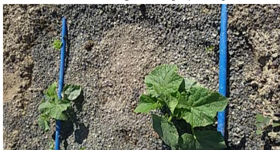
شکل ۱- مالچ‌دهی سنگریزه و اجرای آبیاری قطره‌ای در کرت‌ها

دریاچه قرار دارند و کشاورزان محلی برای بالا بردن کارایی مصرف آب سبزیجات و صیفی‌جات، از مالچ سنگریزه در طی سال‌های قبل استفاده کرده‌اند. آزمایش فاکتوریل به صورت طرح کاملاً تصادفی در سه تکرار در کرت‌های یک مترمربعی اجرا گردید. فاکتور اول مقدار مصرفی سنگریزه هوا خشک (قطر کوچکتر از ۸ میلی‌متر) در پنج سطح صفر، ۱۵، ۳۰، ۴۵ و 60 \text{ kg m}^{-2} (به ترتیب معادل صفر، ۱۵۰، ۳۰۰، ۴۵۰ و ۶۰۰ تن در هکتار) و فاکتور دوم مقدار مصرفی کود مرگی هوا خشک در پنج سطح صفر، ۲۵۰، ۵۰۰، ۷۵۰ و 1000 \text{ g m}^{-2} (به ترتیب معادل صفر، ۲/۵، ۵، ۷/۵ و ۱۰ تن در هکتار) بود. قبل از اجرای آزمایش، برخی ویژگی‌های خاک مانند بافت به روش هیدرومتر و کود مرگی مانند کربن آلی، نیتروژن، pH و EC (عصاره ۱ به ۵) تعیین گردید (Page, 1985; Klute, 1986). در مجموع، ۷۵ کرت آزمایشی در اواسط فروردین ۱۳۹۶ آماده گردید و مقادیر کود مرگی با بیل تا عمق ۲۰ cm خاک به طور یکنواخت مخلوط گردید. در ۳۰ فروردین کرت‌ها به صورت غرقابی آبیاری شده و ۶ روز بعد (۵ اردیبهشت)، تعداد هشت بذر خیار رقم SUPER GREEN F1 (تولید آمریکا و توزیع توسط شرکت GBI در تهران) در هر کرت کاشته شد سپس مقادیر سنگریزه با ضخامت تقریباً یکسان در سطح کرت پخش گردید. انتخاب مقادیر سنگریزه بر مبنای عرف کشاورزان محلی انجام شد و امکان جمع-آوری و استفاده مجدد سنگریزه در کشت سال‌های بعدی نیز وجود دارد. پس از سبز کردن بذور، تعداد آن‌ها به چهار بذر تنک گردید. آبیاری کرت‌ها با استفاده از دو لوله لترال که بر روی هر کدام دو عدد قطره‌چکان نصب شده بود انجام گرفت (شکل ۱).