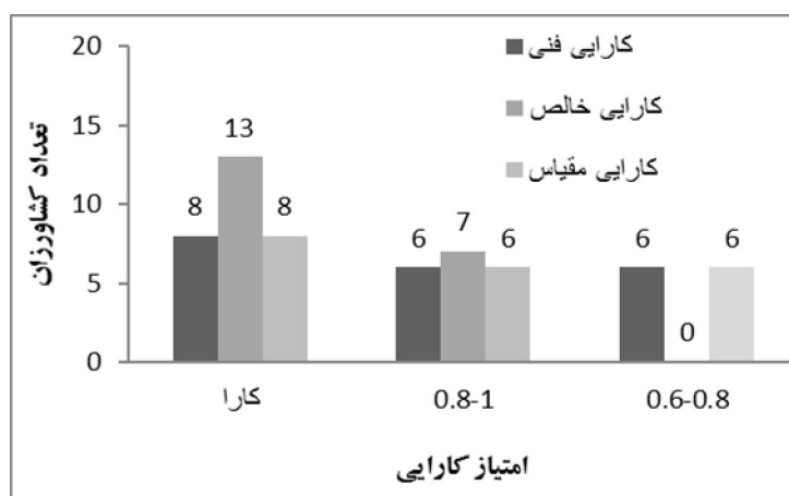
شکل ۲. نمودار فراوانی کشاورزان تولید کننده گندم دیم از لحاظ کارایی

مدل BCC نیز کارا هستند. اختلاف بین تعداد واحدهای با کارایی فنی و کارایی فنی خالص به دلیل نامناسب بودن مقیاس تولید برای واحدها بوده است. همچنین از کشاورزان ناکارا به ترتیب ۶ و ۷ کشاورز دارای کارایی فنی و کارایی فنی خالص در محدوده ۰/۸-۱ بودند. مقادیر میانگین کارایی‌های مختلف برای کشاورزان در جدول (۵) ارائه شده است. همچنین مقادیر انحراف معیار کارایی در بین کشاورزان ارائه گردیده است.