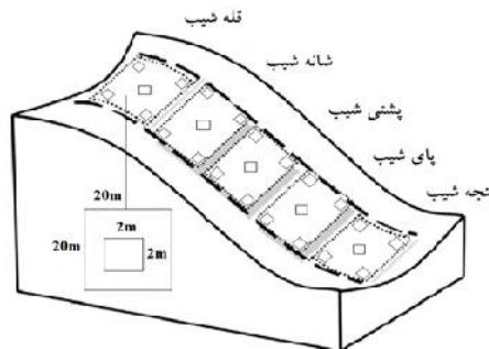
شکل ۱- نحوه‌ی استقرار قطعات نمونه در موقعیت‌های شیب کاتنا Figure 1. Establishment form of sample plots in slope positions of catena

به‌منظور انجام این تحقیق، پارسل شماره ۴۰ (مدیریت نشده) و پارسل شماره ۵۰ (مدیریت شده) جنگل راش در حوزه آبخیز هفت سری سه ناو اسلام در استان گیلان با طول جغرافیایی ۴۰' ۴۸" تا ۴۸' ۴۸" شرقی و عرض جغرافیایی ۳۶' ۳۷" تا ۴۱' ۳۷" شمالی انتخاب شد. اقلیم منطقه بر اساس ضریب دما‌رتن در گروه مرطوب قرار دارد و میانگین ۳۰ ساله بارندگی منطقه برابر ۱۳۸۵/۱۴ میلی‌متر، میانگین دمای سالانه ۱۶/۲۳، میانگین بیشینه دما ۲۵/۹۸ و میانگین کمینه