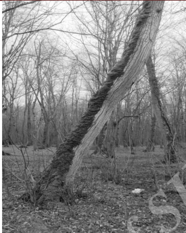
شکل ۳- حضور متراکم خزه‌های پوست نشین در جهت شمالی بر روی گونه لرگ و خصوصیات مورفولوژیک پوست آن