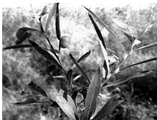
شکل ۵- گال Pontania viminalis روی گونه Salix elbursensis

این آفت در جهان از روی Salix purpurea گزارش شده است. این گونه زنبور سبب ایجاد گال در سطح زیرین برگ‌ها می‌شود. گال‌ها قرمز کروی هستند و در وسط گال حفره‌ای برای زندگی لارو وجود دارد (Hans, 1993). طی این بررسی این گال از روی گونه Salix elbursensis و Salix pycnostachya