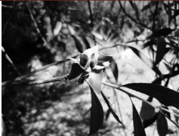
شکل ۸- گال ایجاد شده توسط Rhabdophaga rosaria روی S. alba