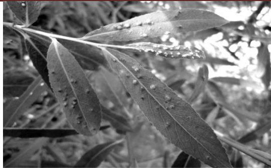
شکل ۳- آثار خسارت کنه مولد گال آبله‌ای Eriophyes tetanothrix روی گونه Salix alba