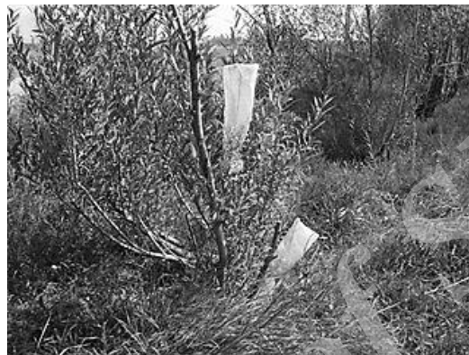
شکل ۱- استفاده از تله‌های توری جهت خروج حشرات گال‌زا

روش‌های زیادی برای اندازه‌گیری تنوع بتا یا تنوع بین زیستگاهی وجود دارد که از مهم‌ترین آن‌ها می‌توان به شاخص‌های تشابه اشاره کرد. تنوع بتا بررسی تغییرات تنوع گونه‌ای در جوامع مختلف بوده و از مهم‌ترین و کارآمدترین این روش‌ها می‌توان به شاخص تشابه سورنسن (رابطه ۱) و شاخص تشابه جاکارد (رابطه ۲)