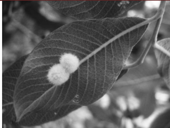
شکل ۶- گال Iteomyia capreae روی گونه Salix aegyptiaca Figure 6. Gall of Iteomyia capreae on Salix aegyptiaca

۵- زنبور مولد گال لوییایی Pontania vesicator (Hans, 1993). این آفت در تمامی مناطقی که انتشار دارد دارای دو نسل در سال است ( Al-Saffar and Aldrich, 1997). بررسی‌ها در این پژوهش نشان داد که در استان آذربایجان غربی نیز این حشره دو نسل در سال دارد (شکل ۷).