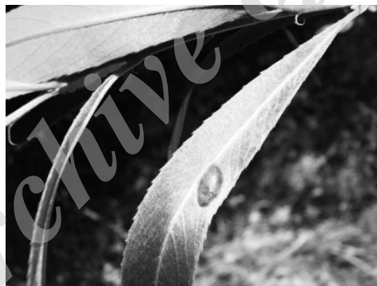
شکل ۷- گال کروی ناشی از زنبور Pontania vesicator روی گونه Salix alba Figure 7. Spherical gall of Pontania vesicator on Salix alba

این آفت یکی از آفات مهم و کلیدی استان است که در تمام مناطق استان روی گونه‌های مختلف با تراکم متفاوت دیده می‌شود. گال‌ها قرمز کروی هستند که در وسط گال حفره‌ای برای زندگی لارو وجود دارد