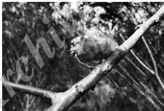
شکل ۹- گال پشه Rhabdophaga heterobia روی گونه Salix triandra

R. heterobia اولین بار در سال ۱۸۵۰ توسط Loew گزارش شده است. گونه Salix triandra میزبان این آفت است. این پشه نوعی گال فقط روی شاتون‌های گونه بید S. triandra در ایستگاه ساعت‌لو ایجاد می‌کند. در بررسی‌های که در صورت گرفته است گونه‌های