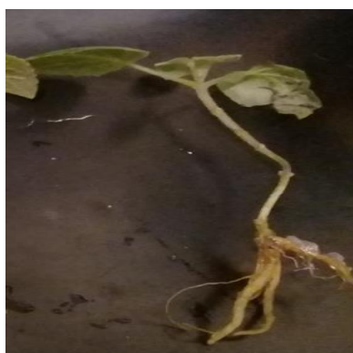
شکل ۳- ریشه‌زایی پالونیا شان‌تونگ در محیط کشت MS ½ همراه با ترکیب تیمار تنظیم کننده رشد IBA با غلظت ۱/۵ میلی گرم در لیتر

با افزایش غلظت IAA درصد ریشه‌زایی افزایش یافته است. بررسی‌ها نشان داد که در محیط کشت MS ½ همراه با تنظیم کننده رشد NAA با غلظت ۱/۵ میلی گرم در لیتر بیشترین میانگین طول ریشه (۴/۸ سانتی‌متر) شد. شایان ذکر است که با افزایش غلظت NAA، طول ریشه افزایش پیدا کرد، لازم به ذکر است که ریشه‌های تشکیل شده در ترکیب تنظیم کننده رشد NAA (محیط کشت MS کامل و MS ½) دارای کیفیت پایینی بودند. طبق بررسی‌های انجام‌شده، بالاترین تعداد ریشه در