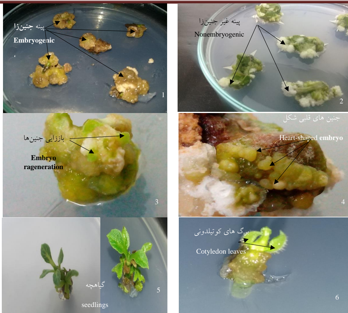
شکل ۲- ۱. پینه‌های جنین‌زا از ریزنمونه برگ در محیط کشت \frac{1}{2} MS + 0.3 mg/l 2,4-D + 2 mg/l TDZ + 4 mg/l Kin + 0.30 mg/l GA3 ۲. پینه غیر جنین‌زا در محیط کشت MS + 0.3 mg/l 2,4-D + 2 mg/l TDZ ۳. باززایی جنین‌ها از پینه‌های جنین‌زا MS+ ۴. مراحل جنین‌های قلبی شکل از ریزنمونه دمبرگ ۵- گیاهچه باززا شده. ۶- مشاهده مرحله دو برگی از جنین‌های باززا شده.