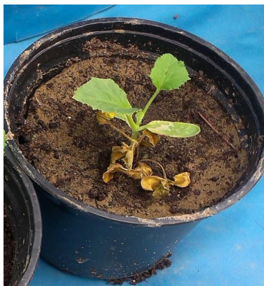
شکل ۲- نتیجه غربال گیاهان نسل BC 2 رقم گرمک به عنوان والد گیرنده. گیاهان موجود در این گلدان آلوده شده‌اند ولی به دلیل اینکه در این خانواده دو گروه گیاه مقاوم و حساس (به ترتیب Rr و rr) وجود دارد، برخی گیاهان مقاوم بوده و سالم هستند در حالی که برخی گیاهان حساس بوده و دو هفته پس از آلوده سازی کاملاً از بین رفته‌اند. در این گلدان ۴ گیاه از خانواده یاد شده کشت شده بود