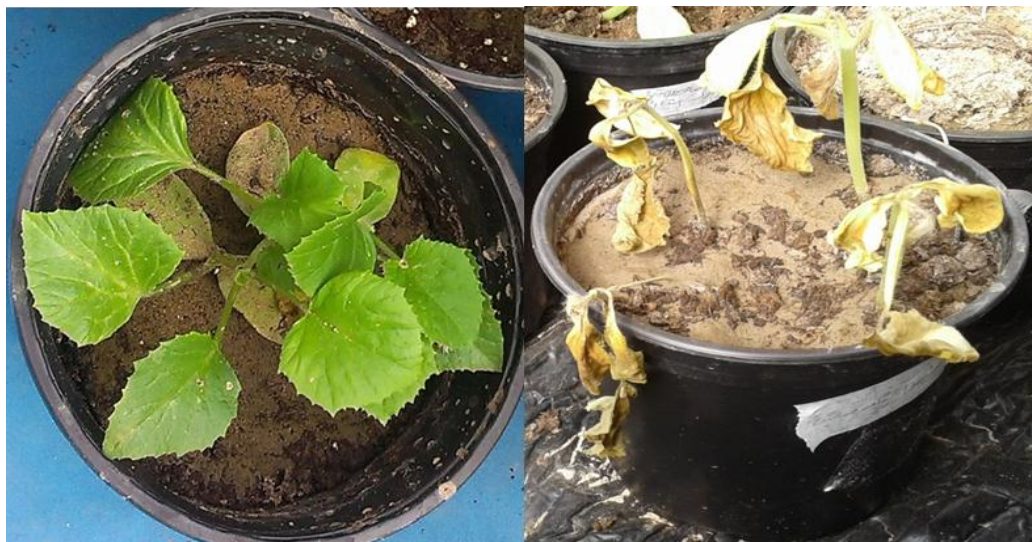
شکل ۱- تصویر گیاه حساس در سمت راست (گرمک) و مقاوم در سمت چپ (ایزابل) پس از سه هفته آلوده سازی با نژاد ۱ عامل بیماری‌زای فوزاریوم ( Fusarium oxysporum f.sp. melonis )