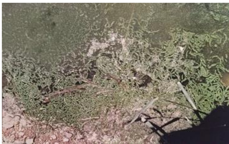
شکل ۲- پلت های دفعی ماهی فیتوفاگ حاوی مواد مغذی

پلت های غذایی حاوی ۷۰ درصد مواد غذایی هضم نشده سفره غذایی گسترده ای را فراهم آورده (شکل ۲) و ماهی کپور معمولی هم به عنوان مصرف کننده