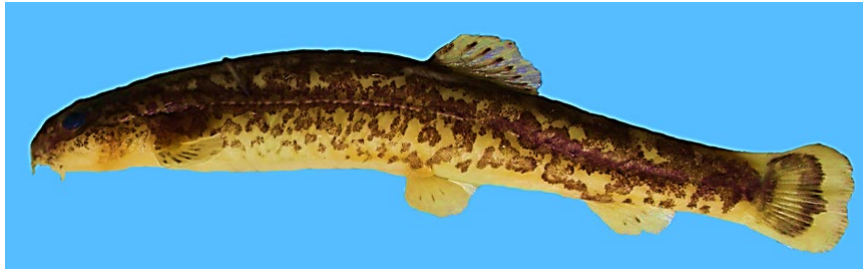
شکل ۱ - نمایی جانبی از گونه Sasanidus kermanshahensis صید شده از رودخانه خرم رود.

شده‌ی صفت اندازه‌گیری شده، M : مقدار اولیه صفت اندازه‌گیری شده، L_S : میانگین طول استاندارد تمامی نمونه‌ها در تمام ایستگاه‌ها، L_0 : طول استاندارد هر ماهی، b : شیب رگرسیون \log M به \log L_0 تمامی نمونه‌ها است (Elliot et al., 1995). کارایی داده‌های اصلاح شده از طریق آزمون معنی‌دار بودن همبستگی بین متغیرها اصلاح شده و طول استاندارد مورد سنجش قرار گرفت. معنی‌دار نبودن این همبستگی نشان‌دهنده‌ی حذف کامل اثر اختلاف اندازه از داده‌ها می‌باشد.