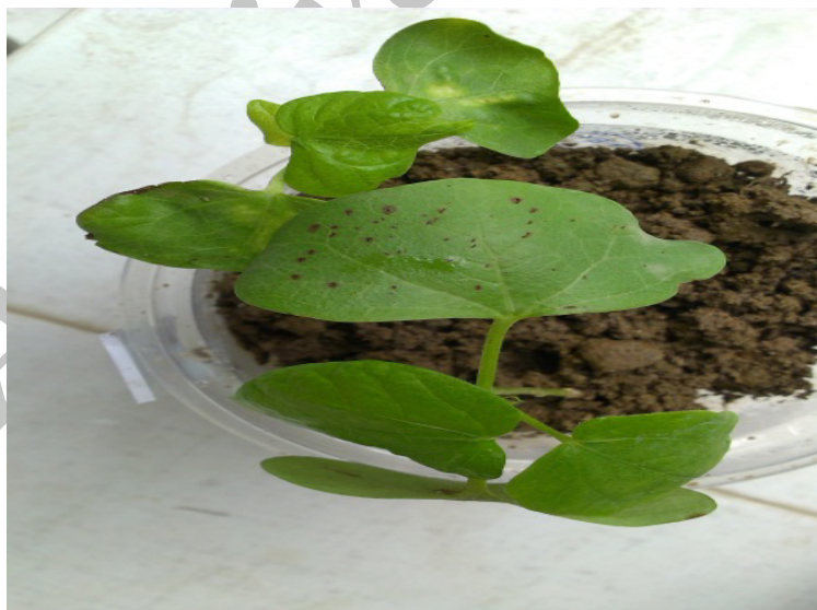
شکل ۱- علائم لکه برگی بر روی برگ گیاهچه تلقیح شده با جدایه A. alternata Kb2 در آزمون بیماری زایی

جداسازی، شناسایی عامل بیماری: در این بررسی تعداد ۱۸ جدایه متعلق به گونه A. alternata جداسازی و شناسایی گردید. همه جدایه ها در آزمون بیماری زایی در شرایط گلخانه بر روی پنبه بیماری زا بودند. روش استفاده از سوسپانسیون قارچ علائم بهتری را نشان داد و از طرفی جدایه kb2 علائم لکه برگی شدیدتری را از خود نشان داد، لذا ارزیابی حساسیت ارقام پنبه با استفاده از این جدایه و روش سوسپانسیون اسپور انجام شد. این جدایه kb2 از رقم گلستان و از ایستگاه تحقیقاتی پنبه کارکنده (کردکوی) جداسازی گردید (شکل ۱).