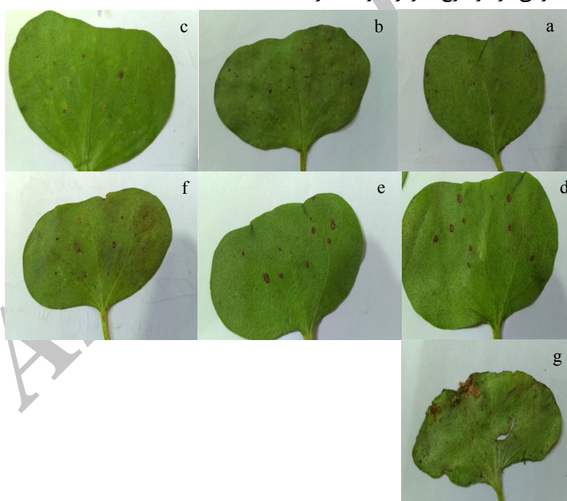
شکل ۳ - علائم لکه برگی ناشی از جدایه (kb۲) A. alternata بر روی ارقام مختلف پنبه.

ارزیابی مقاومت نسبی هفت رقم پنبه در برابر گونه A. alternata : تجزیه واریانس صفت شدت بیماری لکه برگی ناشی از A. alternata انجام شد و نتایج نشان داد که بین ارقام پنبه مورد آزمایش از نظر این صفت اختلاف آماری وجود دارد ( P \leq 0.01 ) (جدول ۱). مقایسه میانگین شدت ارقام مختلف با استفاده از آزمون دانکن در سطح آماری یک درصد صورت گرفت. از نظر شدت بیماری رقم ترموس ۱۴ با ۲/۷۴ درصد بالاترین شدت بیماری را داشت و ارقام ب-۵۵۷ و بختگان دارای کمترین شدت بیماری بودند (شکل ۳ و نمودار ۱). رقم ب-۵۵۷ از ارقام در دست معرفی پنبه در منطقه گلستان می‌باشد. این رقم می‌تواند در مناطق با بارندگی سنگین و رطوبت نسبی بالا در اول فصل و وجود دمای مناسب بیماری لکه برگی در اثر قارچ آلترناریا توصیه گردد.