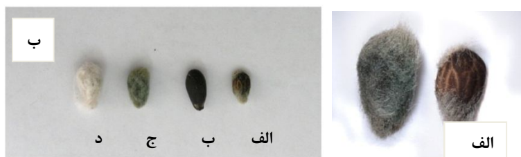
شکل ۱: سمت راست بذره‌های خارج از تیپ پنبه رقم ورامین کوچک‌تر و به‌طور طبیعی تقریباً فاقد کرک‌کو دارای مقدار اندک کرک (الف) در دو انتهای بذرو بذره‌های دارای کرک‌های ریز سبز رنگ (ب) و سمت چپ مقایسه بذره‌های خارج از تیپ پنبه رقم ورامین، بدون کرک طبیعی (الف)، کرک‌گیری شده شیمیائی (ب)، خارج از تیپ کرک سبز (ج) با بذره‌های تیپ دارای کرک‌های زیاد سفید رنگ (د)