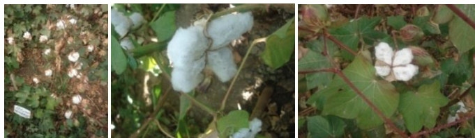
شکل ۲: درجه شکستگی بیشتر غوزه پائین بوته‌های خارج از تیپ کرک سبز رقم ورامین (الف و ب) و غوزه‌های دارای اندازه کوچک‌تر بوته‌های خارج از تیپ بدون کرک (ج).

ارزیابی صفات ریخت‌شناختی بذرهای تولید شده طبقات الیت و و گواهی شده در سال اول و طبقه و گواهی شده و تخم پنبه غیربذری رقم ورامین در سال دوم نشان داد، بذرهای کرک سبز و بدون کرک بذرها و تخم پنبه غیربذری کرک سبز و بدون کرک تولید کردند و در ۲ سال اجرای این آزمایش درصد بذرهای خارج از تیپ افزایش یافت (شکل ۳).