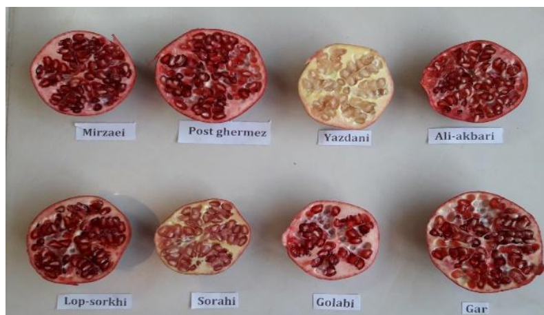
شکل ۱- برش عرضی ارقام انار محلی مورد مطالعه در پژوهش حاضر

میوه‌های رسیده و سالم هشت رقم مختلف انار مورد بررسی در این پژوهش شامل ارقام محلی علی‌اکبری، گر، پوست قرمز، گلابی، سورهی، میرزایی، یزدانی و لپ‌سرخ، از اواخر مهرماه تا اواسط آبان ماه سال ۱۳۹۵ بر اساس زمان بلوغ تجاری میوه‌ها از انارستان روستای جلال‌آباد واقع در شهرستان نجف‌آباد اصفهان برداشت گردید. این انارستان با مساحت ۳۶۰ هکتار، یکی از بزرگ‌ترین