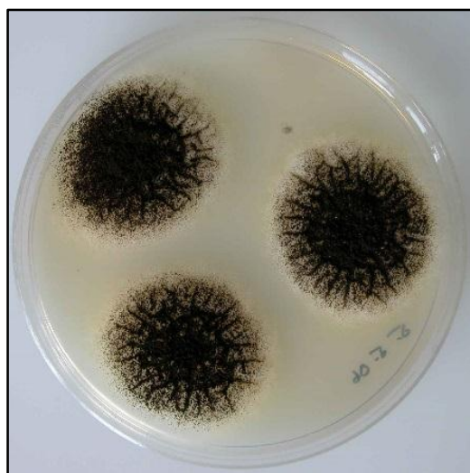
شکل ۱- قارچ آسپرژیلوس نیجر جدا شده از رطب مضافتی

در این پژوهش، میوه‌های خرمای مضافتی با نشانه‌های پوسیدگی از لحاظ آلودگی قارچی بررسی شدند تا بتوان قارچ غالب و عامل پوسیدگی را در آنها شناسایی کرد. گونه‌های قارچ رایزوپوس، پنی‌سیلیوم، فوزاریوم، آلترناریا و قارچ سیاه‌رنگ آسپرژیلوس متعلق به شاخه آسپرژیلوس نیجر از میوه‌های پوسیده خرمای مضافتی جداسازی شدند ولی گونه‌هایی از قارچ آسپرژیلوس سیاه‌رنگ متعلق به شاخه آسپرژیلوس نیجر در تمامی نمونه‌ها (رطب مضافتی) غالب بود (شکل ۱). پرگنه این قارچ روی محیط کشت CZA به رنگ سیاه با کنیدیوفورهای متراکم مشاهده شد. کنیدی‌ها به شکل شعاعی روی وزیکول قرار