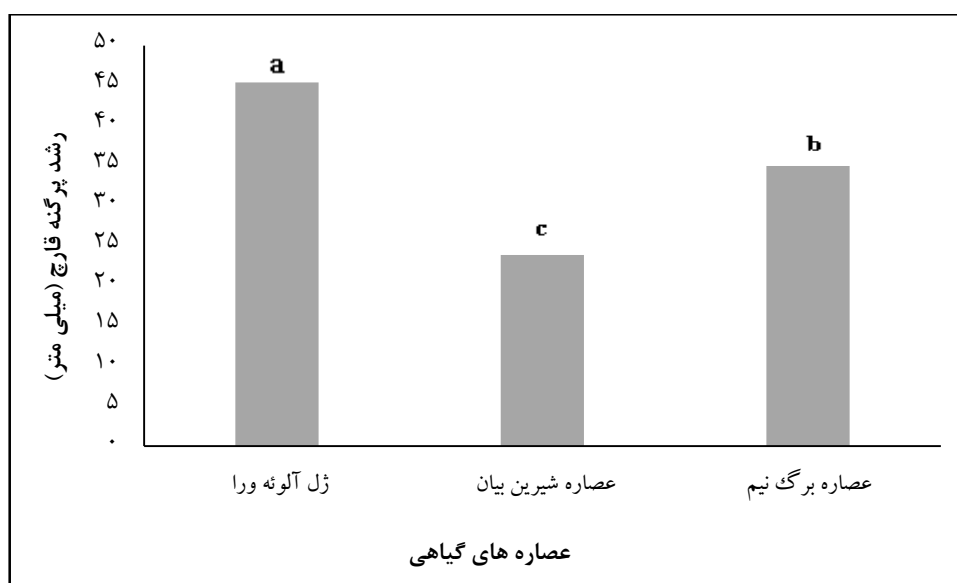
شکل ۲- اثر عصاره‌های گیاهی در رشد قارچ آسپرژیلوس نیجر

* اختلاف معنی‌دار در سطح احتمال ۵ درصد و ** اختلاف معنی‌دار در سطح احتمال ۱ درصد.