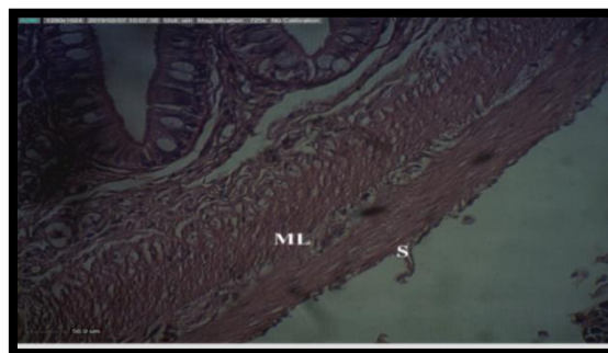
شکل ۲ پرز روده به همراه لایه عضلانی (ML) و لایه سروزی (S) روده قزل آلاهی رنگین کمان تیمار شاهد (H & E stain, \times 725 Original magnification).