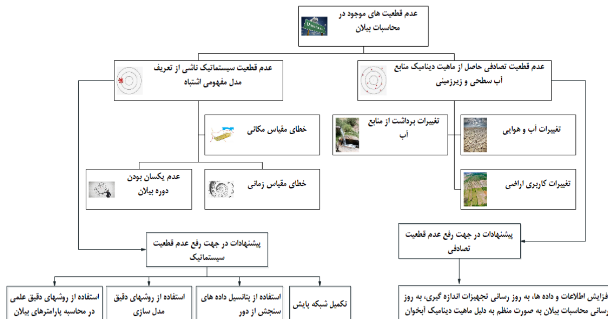
شکل ۲- نمای شماتیک از عدم قطعیت‌های موجود در محاسبات بیلان و پیشنهادهایی در رفع این عدم قطعیت‌ها

قانون و قاعده مشخصی برای تعیین مقیاس زمانی و مکانی در تهیه بیلان محدوده موردنظر وجود ندارد، بنابراین تصمیم‌گیری در این رابطه، به کاربرد بیلان تهیه شده در آینده و داده‌های زمانی و مکانی موجود بستگی دارد (خروجی بیلان در چه موردی قرار است مورد استفاده قرار گیرد و بسته به تصمیم مدیریتی که