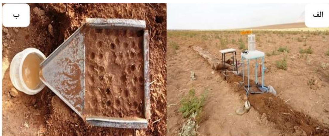
شکل (۳): تصاویری از آزمایش در منطقه سرارود،

الف: نمایی از محدوده مورد آزمایش ب: سطح خاک پس از آزمایش در شیب ۱۲ درصد