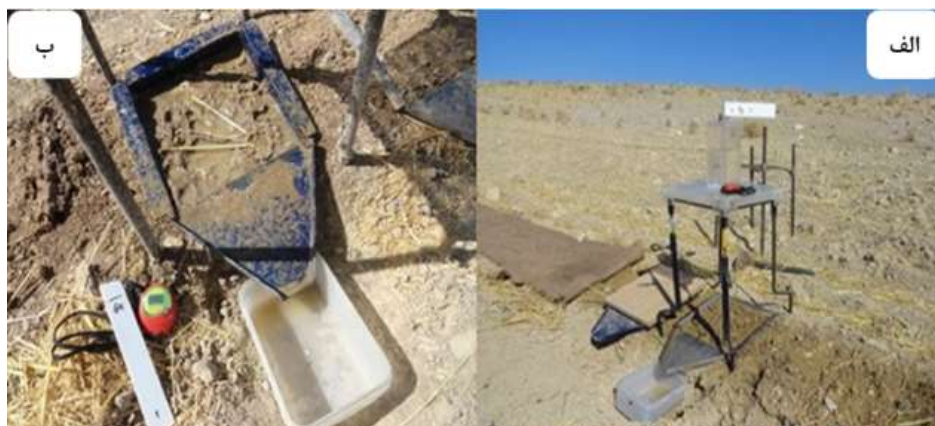
شکل (۲): تصاویری از آزمایش در منطقه پیشکمر،

الف: نمایی از محدوده مورد آزمایش ب: سطح خاک پس از آزمایش در شیب ۱۲ درصد