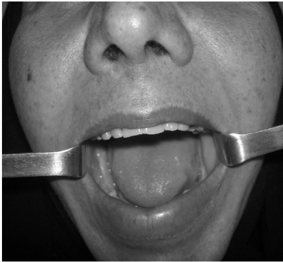
شکل ۴. فوتوگرافی ۶ ماه پس از عمل بیمار میزان باز شدن در حد قابل قبول است