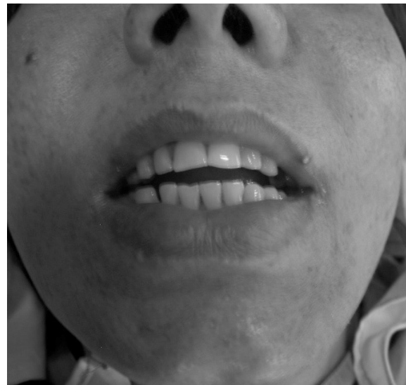
شکل ۱: فوتوگرافی قبل از عمل بیمار

بیمار پس از ارزیابی‌های لازم به اطاق عمل هدایت و تحت بی‌هوشی از طریق NET (Naso-endo tracheal Intubation) که با استفاده از دستگاه فیبراپتیک گذاشته شد مورد عمل جراحی خارج کردن کال استخوانی وسیع ناحیه گونه - زائده کروئوئید و توپروزیته ماگزایلا در سمت راست از طریق برش داخل دهانی قرار گرفت و حدود چهار سانتی‌متر مکعب قطعات استخوانی از ناحیه یاد شده خارج گردید. همچنین چسبندگی‌های بافت نرم ناحیه که باعث کمک به کاهش در میزان باز شدن دهان شده بود آزاد و بافت اسکار از ناحیه خارج شد. لازم به توضیح است که در حین انجام عمل جراحی هیچ گونه ساختمان آناتومیک نرمال در ناحیه کروئوئید - توپروزیته، ماگزایلا و گونه راست