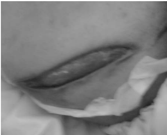
عکس ۱. برش ناحیه درناژ آبه بعد از کنترل عفونت در پهلو راست

دیورتیکول‌های کولون تحت عمل جراحی قرار گرفت. برش جراحی در محل حداکثر تورم در ناحیه پهلو راست داده شد (عکس ۱). عضلات داخلی جدار شکم کاملاً نکروزه همراه با ترشحات بدبو بودند که خارج گشته و دبریدمان وسیع همراه شستشو صورت گرفت. درن‌های متعدد در ناحیه قرار داده شده و بعد از آن روزانه زیر بی‌هوشی عمومی، زخم شستشو داده می‌شد و در صورت نیاز دبریدمان انجام می‌گرفت و طی این زمان آنتی‌بیوتیک وسیع‌الطیف برای درمان مورد استفاده قرار گرفت تا اینکه زخم تمیز و قرمز رنگ شده و آماده ترمیم گردد.