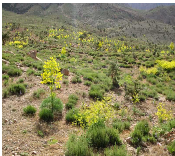
شکل ۱. تصویر پراکنش تیپ غالب گیاهان ناحیه جویبار کرمان از خانواده چتریان

نتایج جالب و گاهی غیر معمول نیز در استفاده بومی گیاهان مورد تحقیق در این مطالعه به دست آمد. به‌طور مثال، می‌توان به گیاه افدرا ( Ephedra procera ) اشاره کرد که دارای اثرات آنتی‌باکتریال، آنتی‌اکسیدانت و ضدقارچ می‌باشد (۲۰، ۲۱). این گیاه در این منطقه مصرف صنعتی جهت تهیه چرم دارد که با توجه به تانن زیاد این گیاه قابل توجهی می‌باشد.