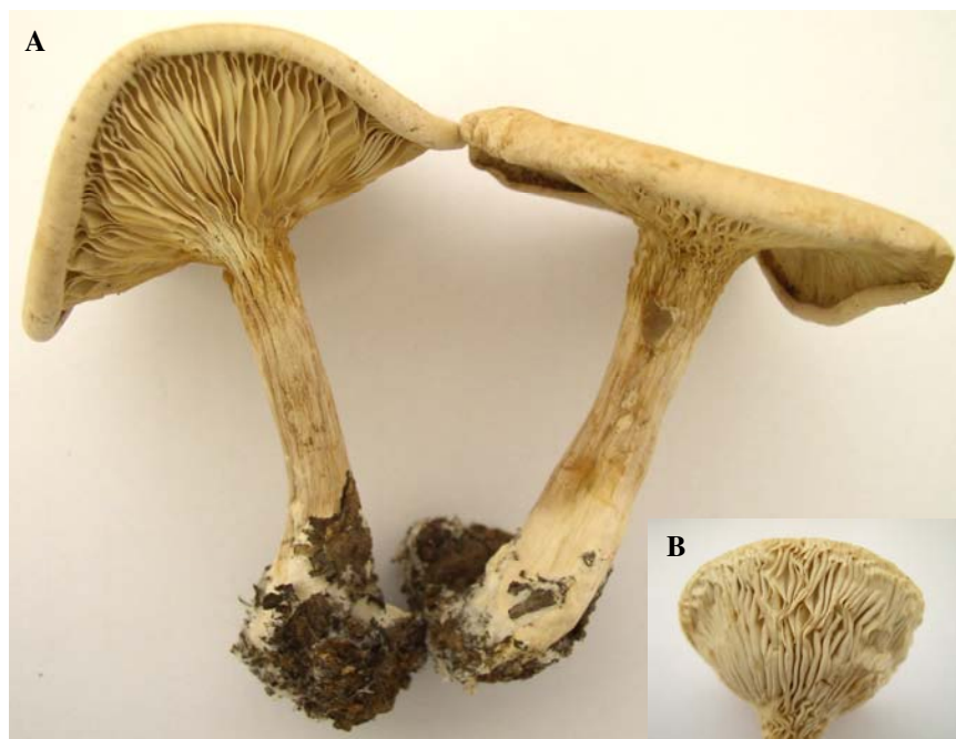
شکل ۲- A. بازیدیوکارپ‌های Clitocybe geotropa با حاشیه پیچ‌خورده، B. حاشیه صاف کلاهک در C. infundibuliformis .

همینوفور منظم (regular) بوده اما در مواردی درهم تنیدگی جزئی در ریشه‌ها دیده می‌شود. قوس اتصال (clamp connection) در محل دیواره عرضی ریشه‌ها موجود است. نمونه بررسی شده: روی خاک، آذربایجان شرقی، ارسباران، کلاله سفلی، ۸۲/۷/۲۶، آصف و تهرانی (IRAN 11939 F).