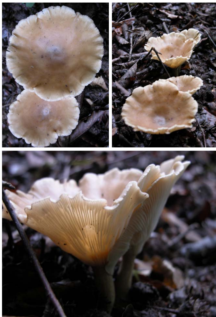
شکل ۱- بازیدیوکارپهای Clitocybe houghtonii : تورفتگی مرکزی، حاشیه موج کلاهک و تیغک‌ها قابل رویت است.