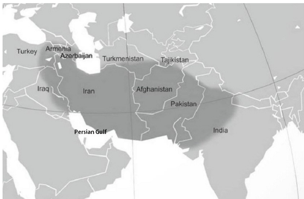
شکل ۲- نقشه پراکنش انارهای خودرو نشان‌دهنده خاستگاه و مرکز پیدایش آن (اقتباس از Morton 1987). Fig. 2. Dispersion map of wild pomegranates showing origin of pomegranate (From Morton 1987).

Melgarejo & Martínez 1992, Mirjalili & Poorazizi ) (2013b, c).