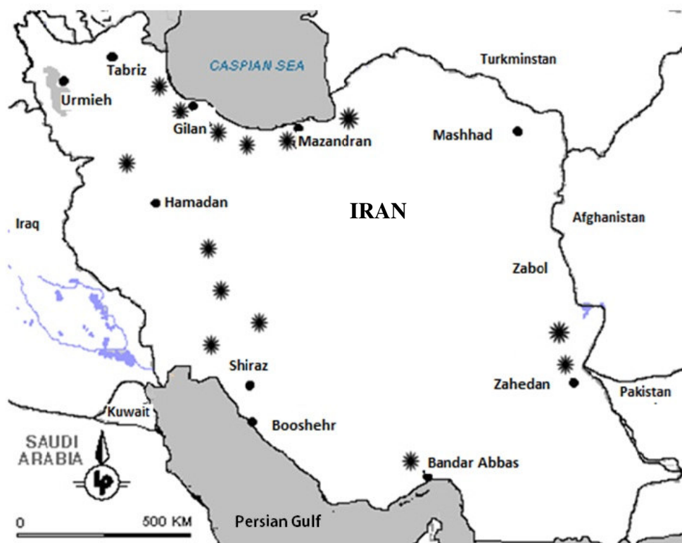
شکل ۳- نقشه پراکنش انارهای خودرو در ایران (اقتباس از Mirjalili & Poorazizi 2013b).