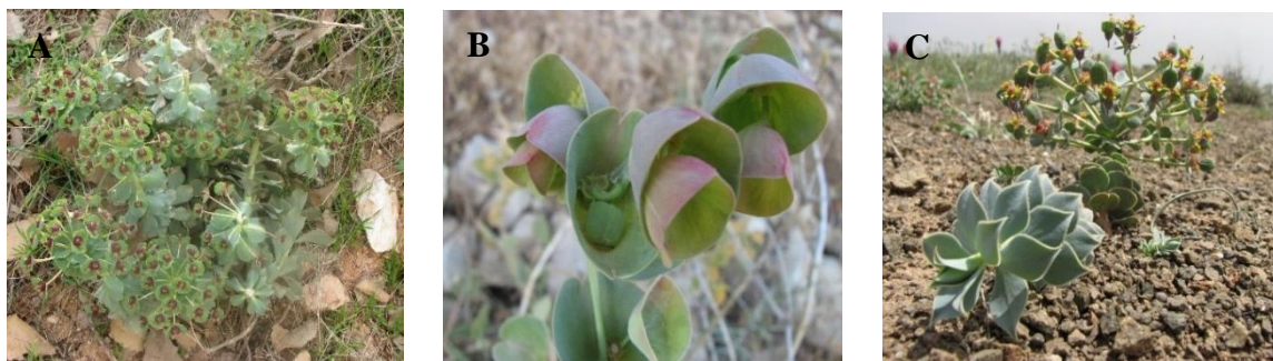
شکل ۲- گونه‌های منتخب از جنس فرفیون در ایران: A-C (گونه‌هایی با پتانسیل زینتی)، A. Euphorbia craspedia ، B. E. erubescens ، C. E. marschalliana . Fig. 2. Selected species of the genus Euphorbia in Iran: A-C (species with ornamental potential), A. Euphorbia craspedia , B. E. erubescens , C. E. marschalliana .