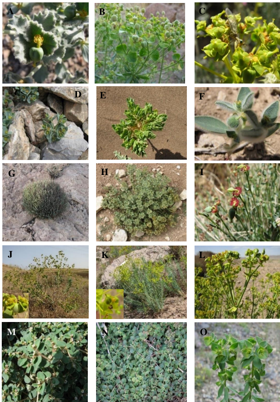
شکل ۱- گونه‌های منتخب از جنس فرقیون در ایران: A-C (گونه‌های انحصاری ایران)، A. E. connata , B. E. hebecarpa , C. E. malleata , D-F (گونه‌هایی با زیستگاه تخصصی)، D. E. aucheri (زیستگاه واریزه‌ای)، E. E. turczaninowii (زیستگاه شن‌های روان)، F. E. petiolata (زیستگاه گچی و شور)، G-I (گونه‌های در معرض تهدید)، G. E. spartiformis (EN)، H. E. sahendi (CR)، I. E. erythradenia (VU)، J-L (گونه‌های خرابه‌روی و مهاجم بومی)، J. E. macroclada (در غرب)، K. E. seguieriana (در شمال غرب)، L. E. microsciadia (در شمال، شمال شرق، مرکز)، M-O (علف‌هرز باغ‌ها، گلخانه‌ها و فضاهای سبز)، N. E. serpens (علف‌هرز باغ‌ها، گلخانه‌ها و فضاهای سبز)، O. E. falcata (علف‌هرز باغ‌ها و مزارع).

Fig. 1. Selected species of the genus Euphorbia in Iran: A-C (endemic species), A. E. connata , B. E. hebecarpa , C. E. malleata , D-F (species of special habitats), D. E. aucheri (screes), E. E. turczaninowii (mobile sandy hills), F. E. petiolata (gypsum and saline soils), G-I (species with threatened status), G. E. spartiformis (EN), H. E. sahendi (CR), I. E. erythradenia (VU), J-L (ruderal and invasive natives), J. E. macroclada (in west of Iran), K. E. seguieriana (in northwest of Iran), L. E. microsciadia (in north, northeast and central of Iran), M-O (weeds of fields and orchards), M. E. chamaesyce (weed of orchards, greenhouses and landscapes), N. E. serpens (weed of orchards, greenhouses and landscapes), O. E. falcata (weed of orchards and fields).