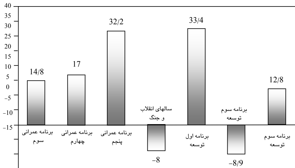
نمودار ۲. متوسط رشد سرمایه گذاری صنعت در دوره‌های مختلف