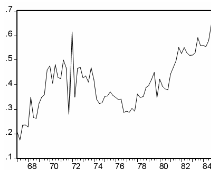
شکل-۱. شاخص بازبودن اقتصاد (openc)

از سوی دیگر، همان‌طور که در شکل ۲ ملاحظه می‌شود، قیمت نسبی کالاهای وارداتی از سال ۱۳۶۷ به این سوی همواره روند صعودی داشته و براساس نتایج این پژوهش به ایجاد فشارهای تورمی در اقتصاد ایران انجامیده‌است. اما در سال‌های اخیر این روند افزایشی ظاهراً کند شده‌است. با توجه به اینکه در یکی دو سال گذشته در ترکیب شرکای تجاری ایران تغییرات قابل توجهی اتفاق افتاده و چین (به دلایل اقتصادی و سیاسی) جایگزین شرکای سنتی اروپایی ایران شده‌است (آلمان و ایتالیا) انتظار می‌رود که قیمت نسبی کالاهای وارداتی در ایران با افت قابل توجهی همراه شود. از آن‌جا که براساس