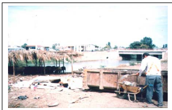
شکل‌های شماره (۳-۴): نحوه جمع‌آوری زباله‌های شهری و مکان‌گزینی آن در فضاهای با ارزش شهری