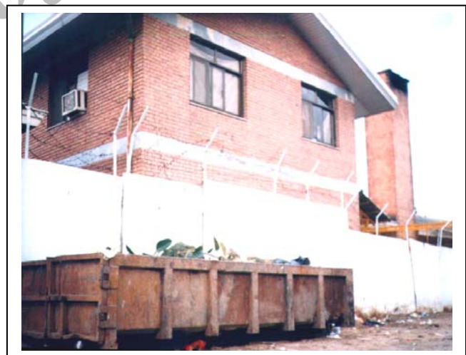
شکل‌های شماره (۱-۲): زباله تولیدی و آمیختگی با محل زیست انسانی

تولیدی، ۹۸٪ زباله خانگی، ۱٪ زباله صنعتی، ۱٪ زباله بیمارستانی در مراکز بهداشتی و درمانی است.