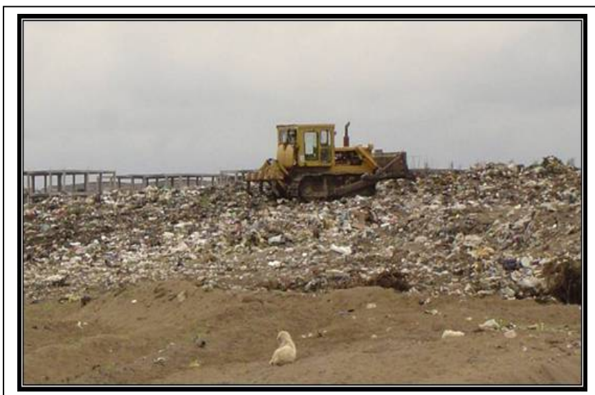
شکل شماره (۷): محل دفن زباله های شهری بابلسر در منطقه پارکینگ هشتم