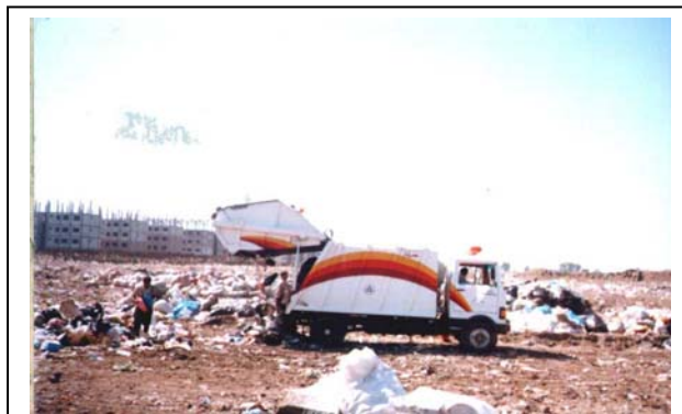
شکل‌های شماره (۵-۶): تجهیزات جمع‌آوری زباله‌های شهری و انتقال به محل دفن زباله