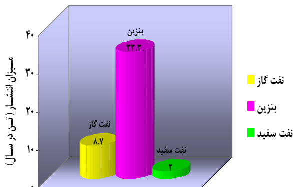
شکل شماره (۱): میزان تبخیر سالانه از کلیه مخازن انبار شمال غرب تهران (تن در سال)

مخزن شماره شش حاوی نفت سفید است. این مخزن از نوع سقف شناور است. میزان تبخیر سالانه با توجه به خصوصیات این مخزن حدود ۰/۵ تن بوده و سهم تلفات ناشی از لوازم عرشه، برداشت از مخزن و درزگیرهای پیرامونی به ترتیب برابر با ۵/۴، ۴۷۷ و ۱۳/۳ کیلوگرم است (جدول شماره ۲). این انبار دارای چهار مخزن نفت سفید بوده بنابراین در حدود ۲ تن تبخیر در سال است. با استفاده از نرم‌افزار میزان انتشار را از کلیه مخازن انبار شمال غرب تهران به دست آورده که انتشار از ده مخزن حاوی نفت گاز، بنزین و نفت سفید به ترتیب برابر با ۸/۷، ۳۳/۳ و ۲ تن در سال است، بنابراین کل برآورد سالانه از این مخازن حدود ۴۴ تن است (شکل‌های شماره ۱ و ۲).