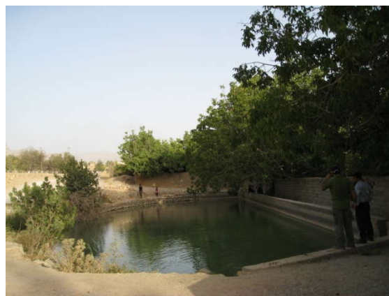
عکس شماره (۶): حوض ماهی

این شهر بیشتر از حد معمول است) در کنار آب واقع شده‌اند. چشمه چهل دختران یکی از مکان‌های متبرک این منطقه است. این چشمه که در ارتفاع ۱۷۱۲ متری و بالاتر از قسمت‌های مسکونی شهر قرار گرفته است تبدیل به زیارتگاه شده است. آب این چشمه متبرک بوده و افراد محلی برای تبرک شدن به این مکان می‌روند. در ضمن به دلیل وفور آب با کیفیت بالا از این مکان برای تفریح نیز استفاده می‌شود. "حوض ماهی" (عکس شماره ۶) که یکی از جذابیت‌های این منطقه است، از اهمیت ویژه‌ای برخوردار بوده به گونه‌ای که با نصب تابلو در اطراف این چشمه به مردم درباره مقدس بودن آن آگاهی می‌دهند (وزارت فرهنگ، ۱۳۳۹). داخل این حوض ماهیان قزل آلابی وجود دارد که مطابق نقل‌های محلی از هزاران سال قبل در این چشمه زندگی می‌کرده‌اند. آب این چشمه نیز دایمی بوده و به گفته ساکنان حتی در سالهای خشکسالی نیز بی آب نمانده است. از آداب زیارت در این محل غذا دادن به این ماهی‌ها و دخیل بستن به درخت انجیر است. هیچ یک از ساکنان در این حوض ماهیگیری نمی‌کنند و معتقدند در صورت خوردن ماهی‌ها فرد دچار بیماری خواهد شد.