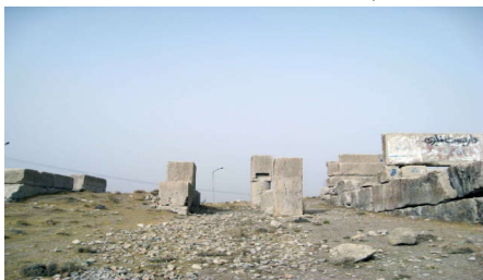
عکس شماره (۲): دروازه شهر اصطخر به سمت سیدان