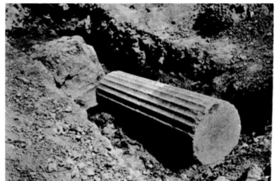
عکس شماره (۴): ستون‌های موجود از قصر هخامنشی در سیدان

در حال حاضر