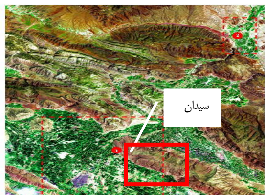
عکس شماره (۱): داده ماهواره‌ای پردازش شده از منطقه پارسه

از لحاظ ویژگی‌های باستانی نیز این شهر در میانه مسیر پارسه تا پاسارگاد قرار گرفته است که با توجه به شواهدی مبنی بر وجود تمدن هخامنشی در این شهر، اهمیت آن را به عنوان حلقه پیوند دهنده این دو شهر باستانی دوچندان می‌کند (عکس هوایی شماره ۱)