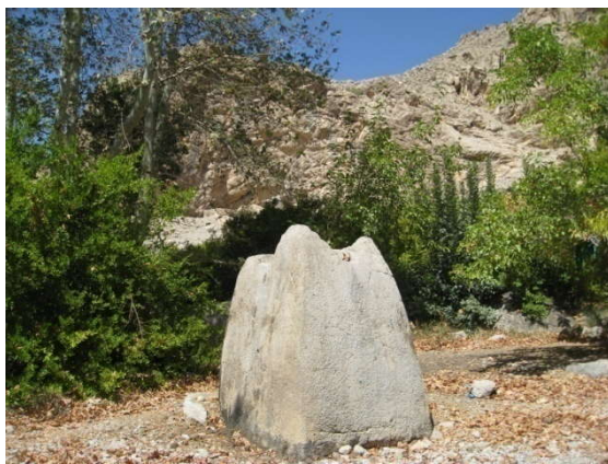
عکس شماره (۵): آتشکده باغ بدره

همان‌طور که از نوشته ویت کمب مشخص است، احتمال این‌که این مکان، مذهبی باشد تقویت می‌شود. وجود یک آتشکده در باغ بدره این ظن را تقویت می‌کند. (عکس شماره ۵) در گزارش‌های باستان‌شناسی ذکر شده است: این آتشکده که متعلق به عصر هخامنشیان است، در حدود ۲ متر ارتفاع دارد و از سنگ تراشیده شده است و اینک نیز جنبه مذهبی دارد و پیرامون آن ساکنین دهات مجاور مراسمی دارند و نذرهایی می‌کنند (وزارت فرهنگ، ۱۳۳۹). در کتاب اقلیم پارس ذکر شده است: