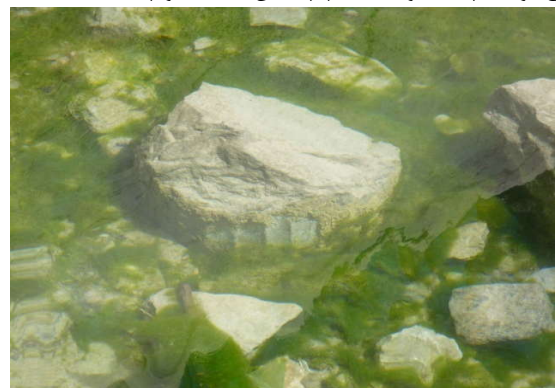
عکس شماره (۳): باقیمانده ستون‌های بنای هخامنشی

در کتاب اقلیم پارس آمده است آثار عهد هخامنشی قره قلات (قصر قلات) در دامنه کوهستان متصل به سیدان و به مسافت دو کیلومتری باغ بدره، تنگه کوچکی وجود دارد که دو چشمه باریک از آن جاری است و برای مشروب ساختن چند باغ کفایت می‌کند - نزدیک تنگ مزبور بر فراز بلندی مختصر کوهستان، صفت کوچکی به وسعت دویست تا سیصد متر مربع ترتیب داده‌اند که تعدادی قطعه ستون هخامنشی (یکی به طول یک متر و نیم از سنگ سیاه و دو قطعه کوچکتر و یک ته ستون نیمه تراش، در آنجا باقی مانده است- این محل به نام قره قلات خوانده می‌شود و نام کوهستان مجاور نیز قره قلات است) (در حال حاضر از آن به نام کوه سیدان یاد می‌کنند) - از میان این صفت کوچک منظر زیبایی آبادی سیدان و تمام جلگه خفرک تا کوه رحمت در معرض چشم انداز فرد قرار می‌گیرد که چنین تصور می‌رود که در روزگاران قدیم سایبان، یا استراحتگاه، یا محلی برای غذاخوری و امثال آن در این نقطه احداث کرده و از منظر مصفا و موقعیت طبیعی آن بهره‌مند می‌شوند... (مصطفوی، ۱۳۴۳) (عکس شماره ۳ و ۴).