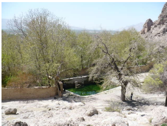
عکس شماره (۷): سیستم تقسیم آب مربوط به دوره هخامنشی

استخر موجود در باغ بدره و قصرقلات عکس شماره (۷) نیز از کاربری مشابهی برخوردارند و افراد برای تفریح به این مکان‌ها مراجعه می‌کنند. همان‌طور که مطالعات نشان می‌دهد، آب یکی از عناصر فیزیکی‌ای که به وفور در سیدان یافت می‌شود، به عنوان یکی از اصلی‌ترین عناصر تشکیل دهنده ساختارهای مذهبی این شهر نیز مورد احترام ساکنان این شهر واقع است. این رسم از دیرباز در این منطقه شایع بوده و همچنان ادامه دارد.