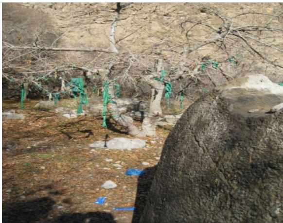
عکس شماره (۸): درخت توت کنار آتشکده که مردم محلی به

این مکان رفته است، توصیه کرد برای شفا گرفتن دخیلی به درخت توت بسته و شمعی در بالای آتشکده روشن کند. (عکس شماره ۸)