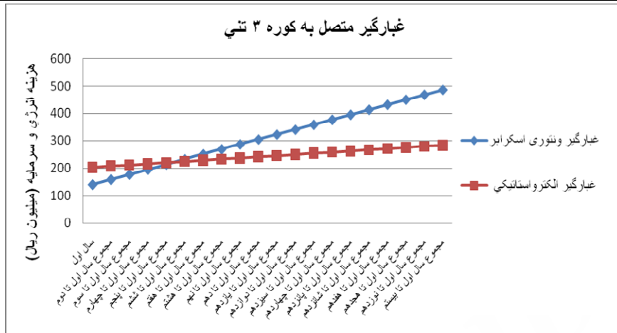
نمودار شماره (۱): مقایسه هزینه انرژی و سرمایه در غبارگیرهای ونتوری اسکرابر و الکترواستاتیکی متصل به کوره ۳ تنی در ۲۰ سال (عمر کاری دستگاهها)