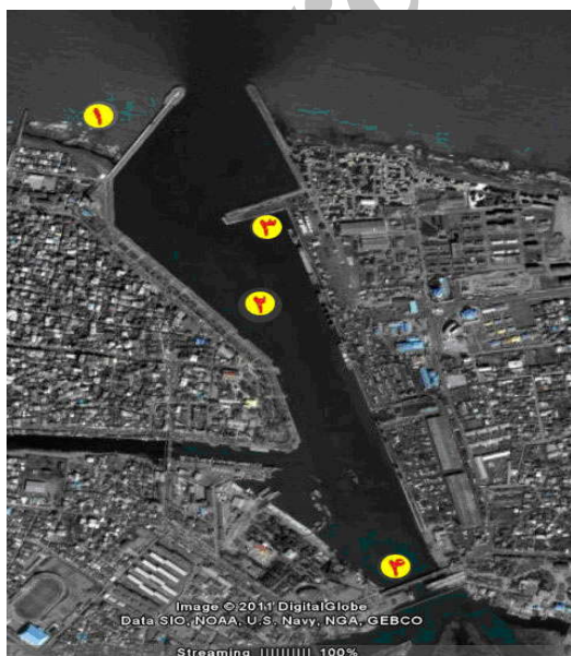
شکل شماره (۱): موقعیت ایستگاههای نمونه برداری در

بندر انزلی در بخش غربی سواحل جنوبی دریای خزر قدیمی‌ترین بندر ایران در این دریا بوده و بیش از ۱۲۰ سال از عمر آن می‌گذرد. این بندر در باریکه بین تالاب انزلی و دریای خزر قرار گرفته و دارای دو بازوی موج شکن سنگی است که حوضچه بندر را تشکیل می‌دهند (شکل شماره ۱).