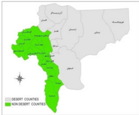
نقشه شماره (۱): شهرستان‌های بیابانی استان اصفهان