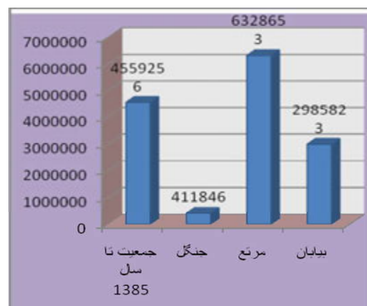
نمودار شماره (۱): مقایسه نسبت جمعیت استان اصفهان به