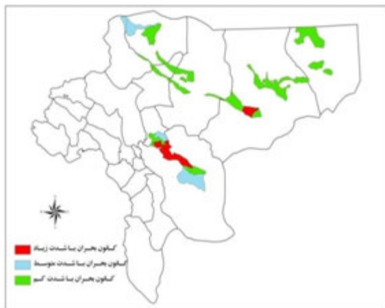
نقشه شماره (۲): نقشه کانون‌های بحرانی فرسایش بادی