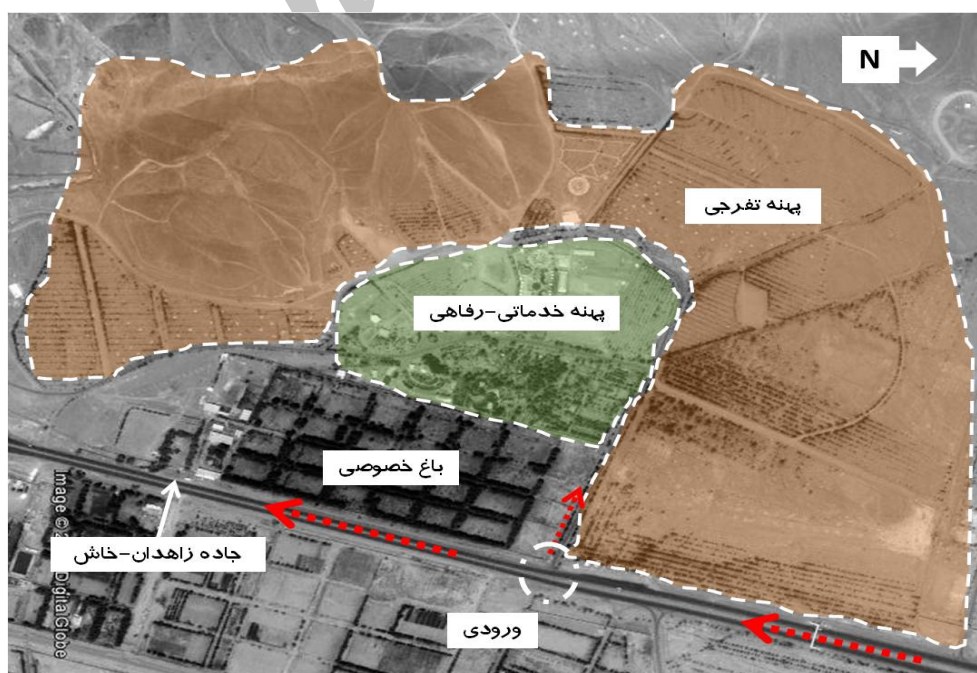
شکل ۱. عکس هوایی از موقعیت پارک ملت زاهدان، کاربری‌های اطراف و پهنه‌بندی آن

الف- پهنه تفریحی: این پهنه با مساحتی بالغ بر ۹۰ هکتار که درصد بیشتر آن را فضا‌های جنگلی دست‌کاشت، تپه و کوه‌ها تشکیل می‌دهند، به‌منزله وسیع‌ترین پهنه