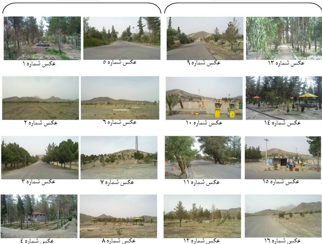
شکل ۳. عکس‌های برگزیده از پهنه‌های پارک جنگلی ملت زاهدان به منظور ارزیابی بصری منظر

بالتر از ۵۹ سال سن داشتند، ۱۲ معیار کلیدی تعیین‌کننده مطلوبیت و نامطلوبی بصری منظر پارک، استخراج شد که از این میان ۶ معیار بیانگر زیبایی و ۶ معیار نشان‌دهنده نازیبایی‌اند (جدول ۱). بر اساس نظرسنجی، نتایج