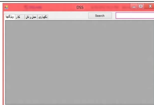
شکل شماره (۳): محیط نرم افزار