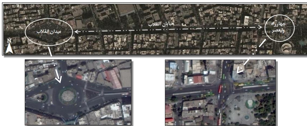
شکل ۱. خیابان انقلاب، حد فاصل میدان انقلاب تا چهارراه ولیعصر

• خیابان کشاورز، خیابانی غربی- شرقی است که در منطقه ۶ تهران واقع شده است (شکل ۲). این خیابان از غرب به خیابان دکتر قریب و از شرق به میدان ولیعصر که حدود ۲/۲ کیلومتر طول دارد، ختم می‌شود. • خیابان فاطمی در منطقه ۶ تهران قرار گرفته و یک خیابان غربی- شرقی است (شکل ۳). این خیابان به علت واقع شدن ادارات دولتی مهم از جمله وزارت کشور و بیمه تأمین اجتماعی حائز اهمیت است.