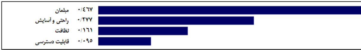
نمودار ۲. اولویت‌بندی مؤلفه‌های مؤثر در شاخص خدماتی و رفاهی با استفاده از نرم‌افزار Expert choice