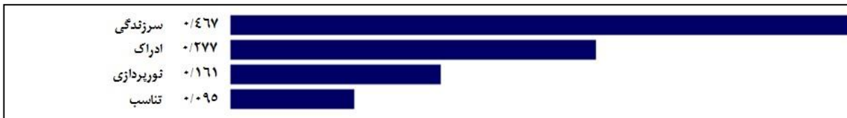
نمودار ۴. اولویت‌بندی مؤلفه‌های مؤثر در شاخص زیبایی‌شناختی با استفاده از نرم‌افزار Expert choice