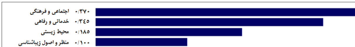
نمودار ۵. اولویت‌بندی شاخص‌های مؤثر در کیفیت خیابان‌های شهری با استفاده از نرم‌افزار Expert choice