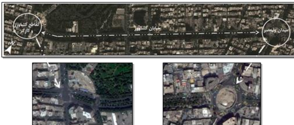
شکل ۲. خیابان کشاورز، حد فاصل میدان ولیعصر تا تقاطع کشاورز و کارگر شمالی