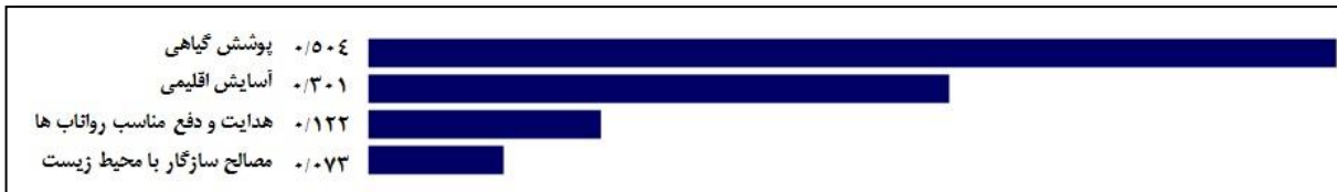
نمودار ۳. اولویت‌بندی مؤلفه‌های مؤثر در شاخص زیست‌محیطی با استفاده از نرم‌افزار Expert choice