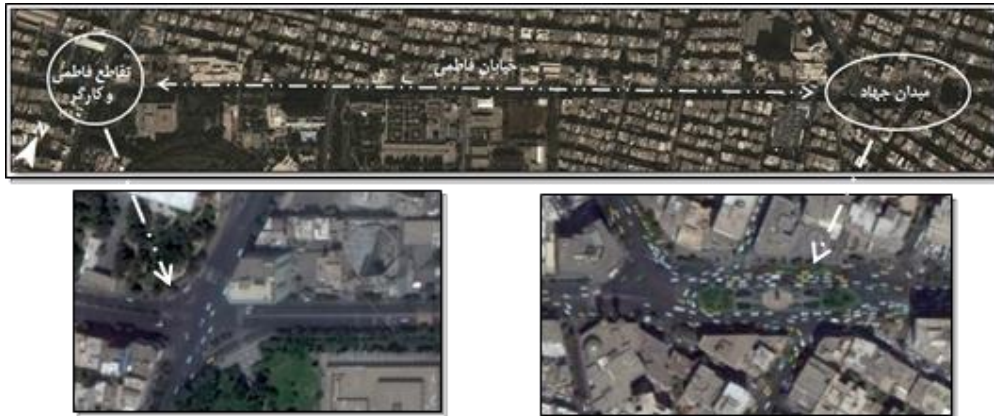
شکل ۳. خیابان فاطمی، حد فاصل میدان جهاد تا تقاطع فاطمی و کارگر شمالی