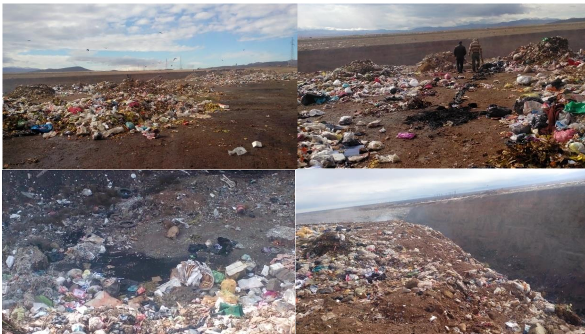
شکل ۲. محل دفن زباله شهری (لندفیل) در تاکستان

از برخی استانداردهای معتبر ارائه‌شده از طرف مؤسسه استاندارد و تحقیقات صنعتی ایران، استاندارد آب شرب صنعت آب کشور، سازمان بهداشت جهانی و استاندارد آب شرب اتحادیه اروپا استفاده شده است. از این رو پیش از ارائه نتایج، استانداردهای استفاده‌شده در قالب جدول ۲ ارائه شده است.