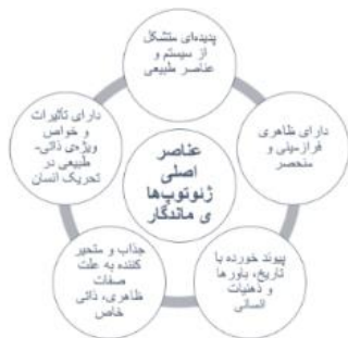
شکل ۲. مدل عناصر و معیارهای اصلی مناظر ژئوتوپ‌های ماندگار.

به‌منظور ارتقای کمی و کیفی در مناظر فرازمینی و اسطوره‌ای، شناخت عناصر اصلی، روابط میان آن‌ها و معیارهای ماندگاری‌شان ضروری به نظر می‌آید. براساس تحقیقات میدانی و علمی-تاریخی به عمل آمده از کوه‌ریگ و برخی دیگر از ژئوتوپ‌های ماندگار، چنین پدیده‌های ماندگاری، دارای چندین معیار مشترک‌اند (شکل ۲) که باید برای حفاظت، بقا و ماندگاری آن‌ها تلاش کرد.