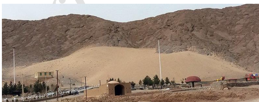
شکل ۱. کوه‌ریگ بغداد آباد مهریز در استان یزد

از نمونه‌های بارز این مناظر فرازمینی چهره‌های فرسایشی‌اند؛ که کوه‌ریگ‌ها نمونه‌ای از این مناظر است. این مناظر، از نظر تاریخی، طبیعی و فرهنگی برای بسیاری