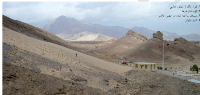
شکل ۳. نمایش کوه‌ریگ از بدنه جانبی ۱۳۹۳.

به‌رغم کشش کوه‌ریگ، این پدیده که در منطقه گرمسیری است آمادگی حضور مردم را در آغوش و بستر خود داشته است. موقعیت کوه‌ریگ، و هم کوه مجاور، مکان تجمع ریگ‌ها را در سایه و شرایط مطلوب قرار می‌دهد (شکل ۳). این حسن طبیعی باعث می‌شود تا از داغی و سوزاندگی ریگ‌ها کاسته شود و درجه حرارت آن، به حد بسیار مطلوبی برسد. از طرفی دیگر، در قدیم، در راستای مسیر منتهی به کوه‌ریگ، مناظر سایه‌انداز باغی و کشاورزی گسترش بیش‌تری داشته است.