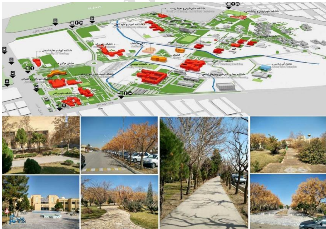
شکل ۱. دانشگاه فردوسی مشهد و تصاویری از مجموعه. مأخذ: وبسایت دانشگاه فردوسی مشهد، ۱۳۹۶. تصاویر از نگارندگان

در این بررسی روش تحقیق از نوع توصیفی - تحلیلی است و برای به دست آوردن اطلاعات از ابزار پرسشنامه استفاده شد.