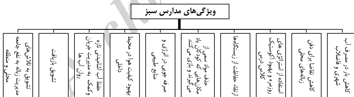
شکل ۱. ویژگی‌های مدارس سبز

منشور جامع مدارس محیط‌زیستی، مزایای این مدارس