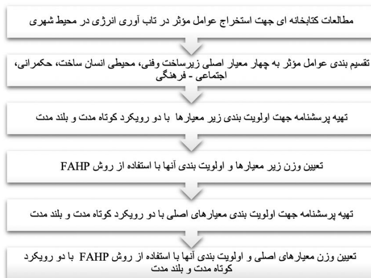
شکل ۲. مراحل تحقیق

اساتید، متخصصان و مدیران دولتی در حوزه انرژی بودند. پرسشنامه تهیه شده برای سنجش اهمیت هر یک از زیر معیارها در تاب‌آوری انرژی شهری در دو رویکرد کوتاه مدت و دراز مدت به تفکیک در طیف لیکرت با مقیاس پنج درجه طراحی گردید. پس از دریافت پاسخ از خبرگان، نتایج در نرم‌افزار آماری SPSS ثبت شده و پایایی پرسشنامه سنجیده شد. برآورد پایایی با استفاده از تعیین همبستگی درونی با روش آلفای کرونباخ که شایع‌ترین روش آماری برای بدست آوردن پایایی است، صورت گرفت. (جدول ۷) از آنجایی که عوامل مؤثر بر اساس میزان فراوانی در منابع معتبر استخراج گردیدند روایی آنها تا حد زیادی قابل قبول می‌باشد. سپس اولویت بندی زیر معیارها در هر یک از چهار زیرگروه فنی و زیرساختی، محیطی انسان ساخت، حکمرانی و اجتماعی - فرهنگی با انجام مقایسه زوجی و استفاده از روش FAHP به صورت جداگانه و در دو رویکرد کوتاه مدت و بلند مدت به تفکیک صورت گرفت. نرخ ناسازگاری نیز محاسبه شد و با توجه به آنکه عدد بدست آمده در هر یک از