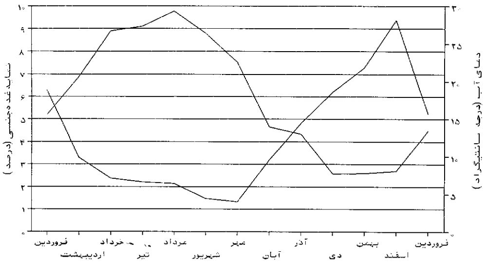
نمودار ۳: مقایسه بین نمایه غدد جنسی و دمای آب در تالاب انزلی طی سال ۱۳۷۶