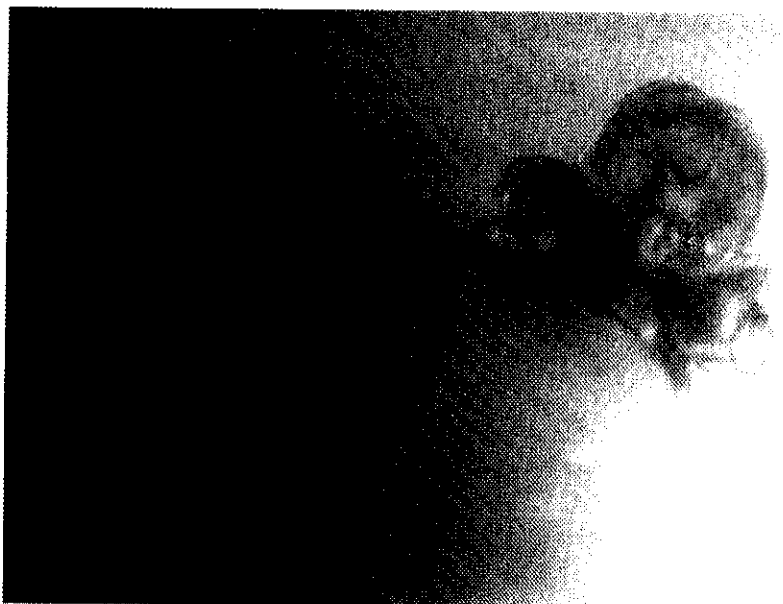
شکل ۲: مرحله ابتدایی رشد جنین ماهی مرکب Sepia pharaonis

لکن اندازه جنین کوچک‌تر از اندازه زرده می‌باشد و از اواسط هفته دوم به بعد با تحلیل زرده و تغذیه جنین اندازه بدن جانور بیش از اندازه زرده می‌شود (شکل ۲). بتدریج در اواسط هفته چهارم زرده تحلیل رفته و نوزاد از درون کپسول تخم خارج می‌شود.