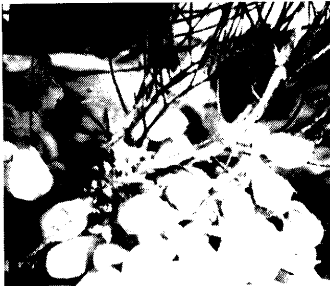
شکل ۱: توده تخم ماهی مرکب Sepia pharaonis

(Forsythe & Heukelem, 1987). بررسی‌های انجام شده در محیط دریایی حاکی از پراکنش قابل ملاحظه تخم‌های ماهی مرکب طی ماه‌های بهمن، اسفند و فروردین و همچنین شهریور و مهر بوده است. مطالعات انجام شده قبلی نیز مؤید وجود دو فصل تخم‌ریزی شامل تخم‌ریزی بهاره (اوایل اسفند تا اواسط اردیبهشت) و تخم‌ریزی پاییزه (اواسط شهریور تا اواخر آبان) می‌باشد (ولی نسب، ۱۳۷۱). مطالعات انجام شده در حوزه اقیانوس هند نیز حاکی از وجود تخم‌ریزی‌های مکرر این گونه طی ماه‌های آبان و آذر و همچنین اسفند و فروردین در حوزه غربی و مهر تا آذر و فروردین تا خرداد در حوزه شرقی هند می‌باشد (Silas et al. , 1982). تخم‌های ماهی مرکب به صورت خوشه‌هایی در کنار یکدیگر و چسبیده به بسترهای سخت و محکم اتصال یافته و کرم رنگ و شفاف می‌باشند. مطالعات انجام شده روی بیش از ۳۷۰۰ تخم ماهی مرکب حاکی از آن است که تخم‌ها بیضی شکل می‌باشند. خوشه‌های تخم که از دریا و از روی قفس‌های صید (گرگورها) جمع‌آوری شدند حاوی حدود ۹۸ درصد از جنین‌های زنده بودند لکن توده تخم‌هایی که به کنار ساحل آمده و از آنجا جمع‌آوری می‌شدند حاوی ۲۰ الی ۸۵ درصد جنین زنده بودند و معمولاً این دسته از تخمها رنگ قهوه‌ای و یا نارنجی تیره را بخود می‌گرفتند (شکل ۱).