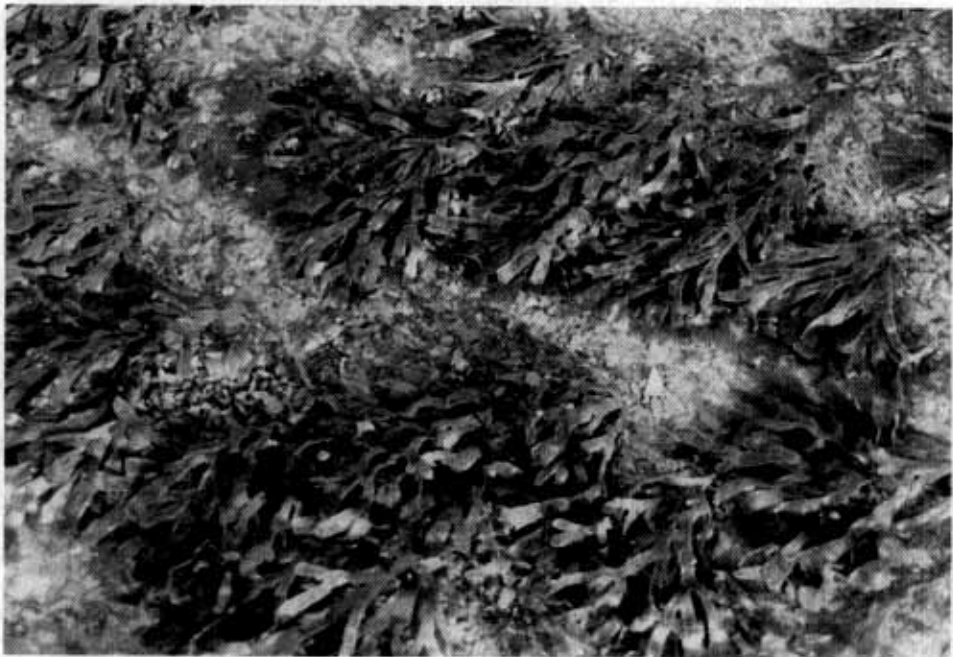
شکل ۲: Stoechospermum marginatum J.Agardh

۱۳ تا ۱۵ متری به بعد صخره‌های مرجانی پدیدار می‌شدند و در مناطق دیگر حداکثر تا عمق ۶ متری صخره‌ای و تا عمق ۸ تا ۱۰ متری صخره‌ای ماسه‌ای و از آن به بعد تبدیل به ماسه‌ای گلی می‌شدند. لازم به ذکر است که کلیه اندازه‌گیری‌های عمق بطور متوسط در نظر گرفته شده است، یعنی عمق‌ها در دو زمان جزر و مد اندازه‌گیری شده و حد واسط آنها محاسبه گردیده است. نمونه‌های برداشت شده بصورت فصلی از بستر دریا، مربوط به سه گروه جلبکهای سبز، قهوه‌ای و قرمز بوده و تعداد این نمونه‌ها ۴۱ گونه بوده که ۳ گونه آن مربوط به جلبکهای سبز، ۱۶ گونه مربوط به جلبکهای قهوه‌ای و ۲۲ گونه مربوط به جلبکهای قرمز می‌باشد. اسامی جلبکهای مزبور در جداول ۲ نشان داده شده است.