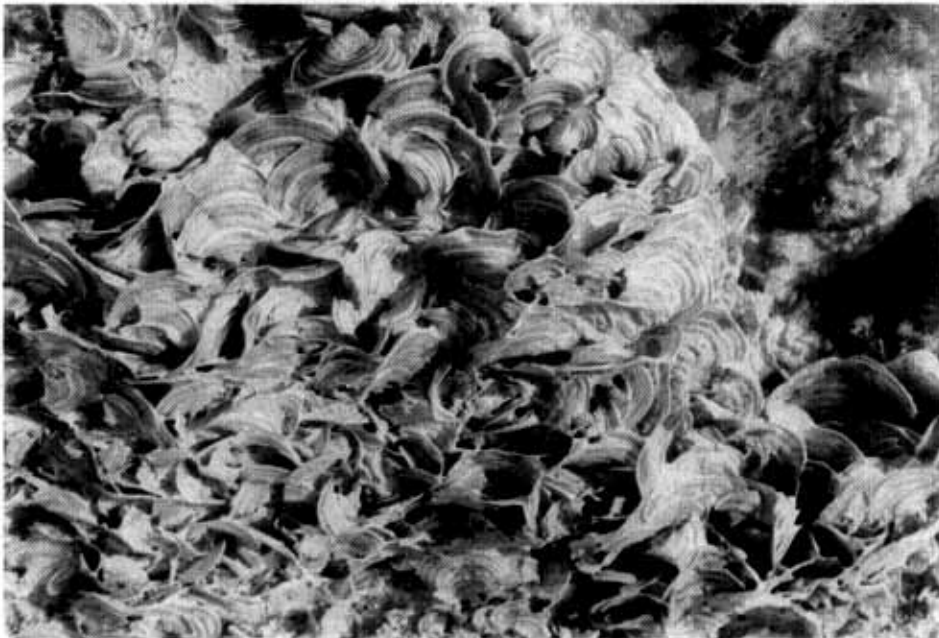
شکل ۴: Padina australis Huck