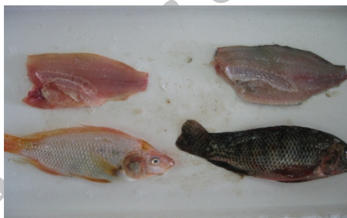
شکل ۱: ماهی تیلاپیای کامل و فیله