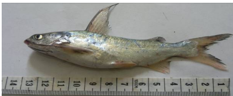
شکل ۲: گربه ماهی خالدار Arius maculatus صید شده از آبهای خلیج فارس

همچنین ماهیان دارای میانگین ( \pm انحراف معیار) وزنی برابر 42/9 \pm 56/1 گرم با دامنه تغییرات 9/3 - 190/1 گرم بودند. برخی خصوصیات ریخت‌سنجی نسبی این گونه جمع‌آوری شده از خلیج فارس در مقایسه با دیگر جمعیت‌ها در جدول ۱ ارائه شده است.