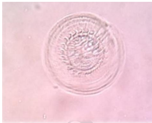
شکل ۱: انگل Trichodina sp. جدا شده از ماهی گورامی دارف (۱۸۶ برابر).