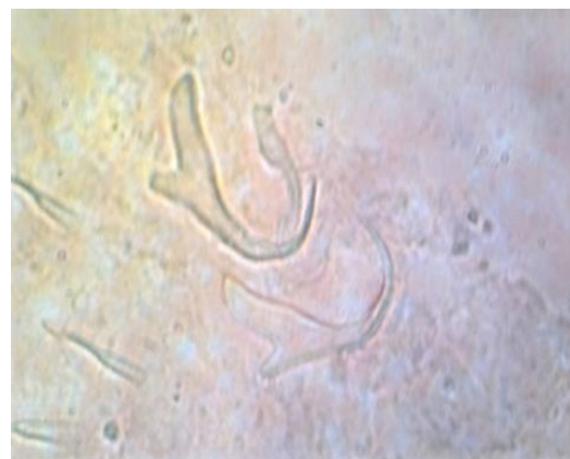
شکل ۷: قلاب‌های انگل Dactylogyrus sp. جدا شده از ماهی آنجل (۲۹۸ برابر).

تک‌یاخته‌ها را بیشتر از سایر گروه‌های انگل‌ها جدا کرده‌اند. بررسی خلفیان و همکاران (۱۳۸۹) نشان دهنده‌ی فراوانی بالای انگل‌های منوزن جنس‌های Dactylogyrus و Ichthyophthirius و ژیروداکتیلوس و تک‌یاختگان تریکودینا و کریپتوبیا در ماهیان آکواریومی از نوع ماهی قرمز حوض، اسکار، گویی و ماهی شیشه چسب در شهرستان اهواز می‌باشد که تا حد زیادی با نتایج تحقیق حاضر همخوانی دارد. در تحقیقی مشابه تاجی‌زادگان و همکاران (۱۳۸۷) آلودگی پوست ماهی گویی به انگل Ichthyophthirius