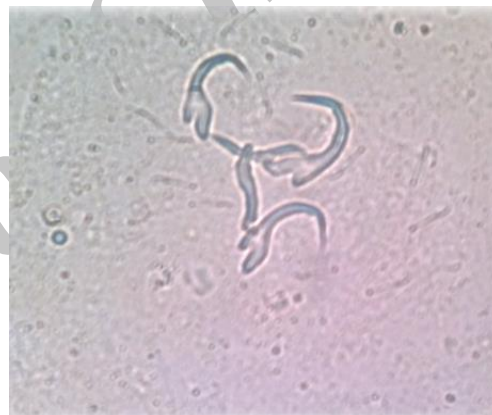
شکل ۲: قلاب‌های انگل Trianchoratus sp. جدا شده از ماهی گورامی دارف (۲۱۲ برابر).