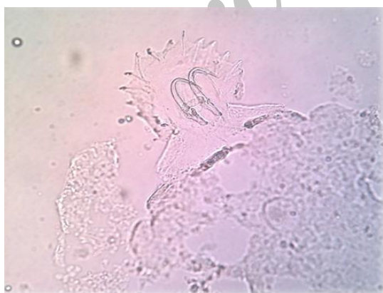
شکل ۶: قلاب‌های انگل Gyrodactylus sp. جدا شده از ماهی آنجل (۱۹۵ برابر).