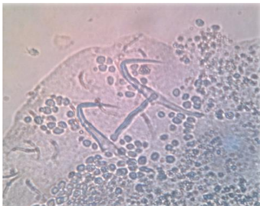
شکل ۴: قلاب‌های انگل Dactylogyrus spiralis جدا شده از ماهی قرمز حوض (۲۸۰ برابر).