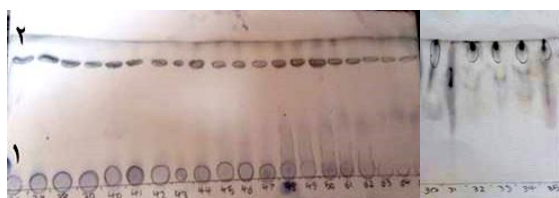
شکل ۱: کروماتوگرافی لایه نازک ساپونین استخراج شده از S. hermanni Figure 1: TLC for Saponin extracted from S. hermanni

طبق نتایج بدست آمده از کروماتوگرافی لایه نازک فرکشن شماره ۳۰ تا ۳۵ یک لکه به رنگ بنفش-آبی با R_f = 0/9 را نشان می‌دهد. از آنجایی که R_f لکه آشکار شده در محدوده R_f ساپونین‌های استروئیدی می‌باشد، ترکیب موجود در این فرکشن‌ها ساپونین استروئیدی شناسایی شد. علاوه بر این در فرکشن‌های ۳۶ تا ۵۰ و ۶۱ تا ۶۵ دو لکه ظاهر شد که لکه شماره (۱) با رنگ بنفش و R_f = 0/05 می‌باشد و R_f لکه ظاهر شده در محدوده R_f ساپونین گلیکوزیدی می‌باشد و لکه دوم به رنگ بنفش تیره با R_f = 0/82 و 0/84 در محدوده R_f ساپونین استروئیدی می‌باشد. پس در این صورت در این فرکشن‌ها دو نوع ساپونین گلیکوزیدی و استروئیدی شناسایی شد (Wagner and Blatt, 1996). فرکشن‌هایی که لکه با رنگ و R_f یکسان داشتند با یکدیگر ترکیب شدند و میزان ۲ گرم ساپونین استروئیدی و ۳/۵ گرم ساپونین گلیکوزیدی - استروئیدی تهیه شد و سپس خواص ضدباکتریایی آن‌ها بررسی شد.